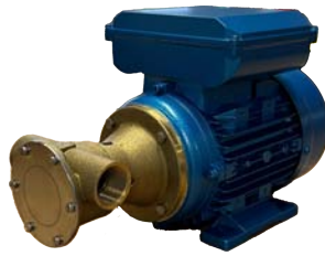
Elektropumpe F-5 T4 Messing