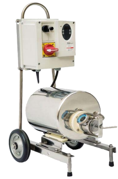
auf Handwagen (optional)