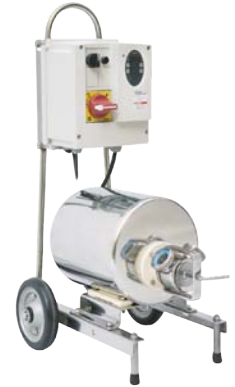
auf Handwagen (optional)