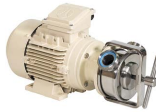
Elektropumpe R-10 230V