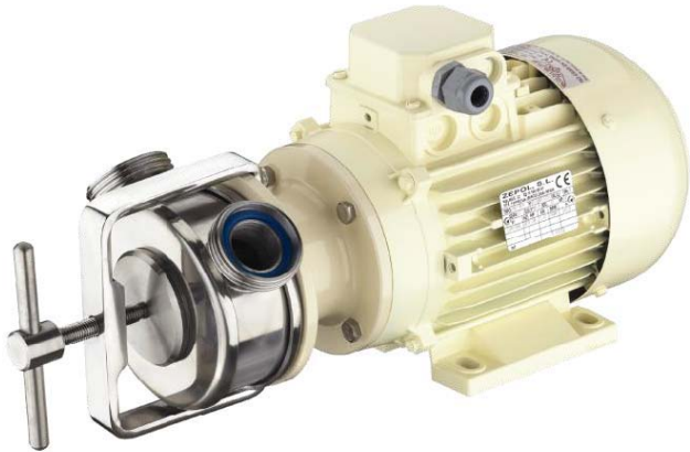
Elektropumpe R-10 230/400V